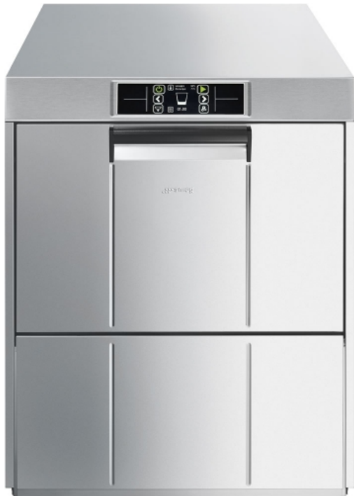
Gläserespülmaschine, doppelwandiges Gehäuse, 400V, Korb 500x500 mm