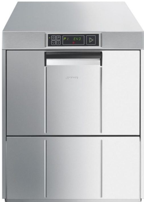
Gläsererspülmaschine, doppelwandiges Gehäuse, 400V, Korb 500x500 mm